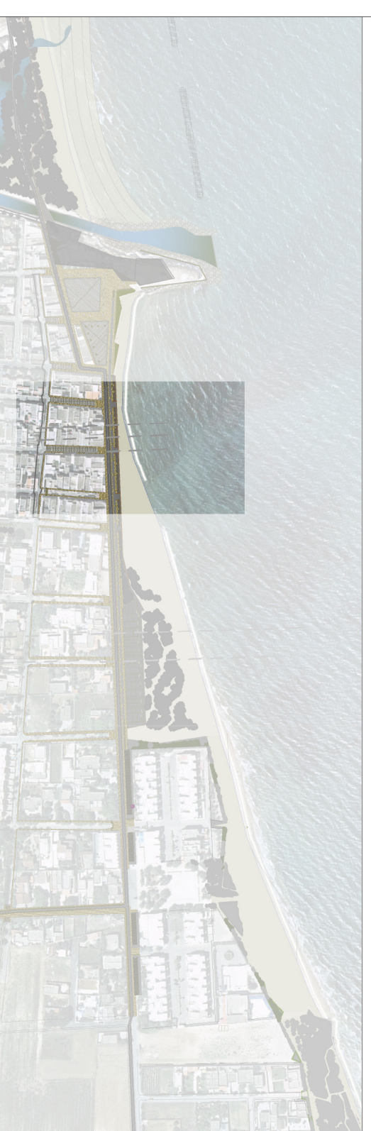
TAVOLA N° 09